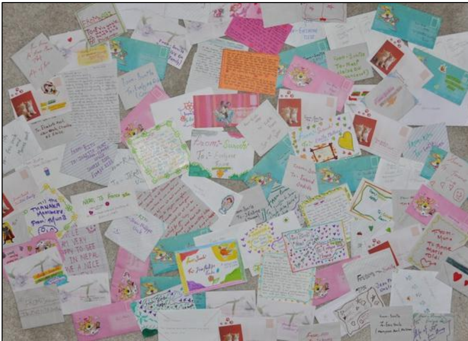
Mise en place de formules de parrainages en 2012