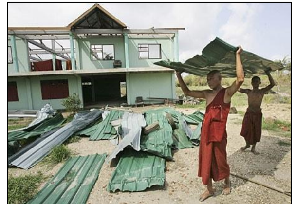
Typhon Nargis Delta du Mekong