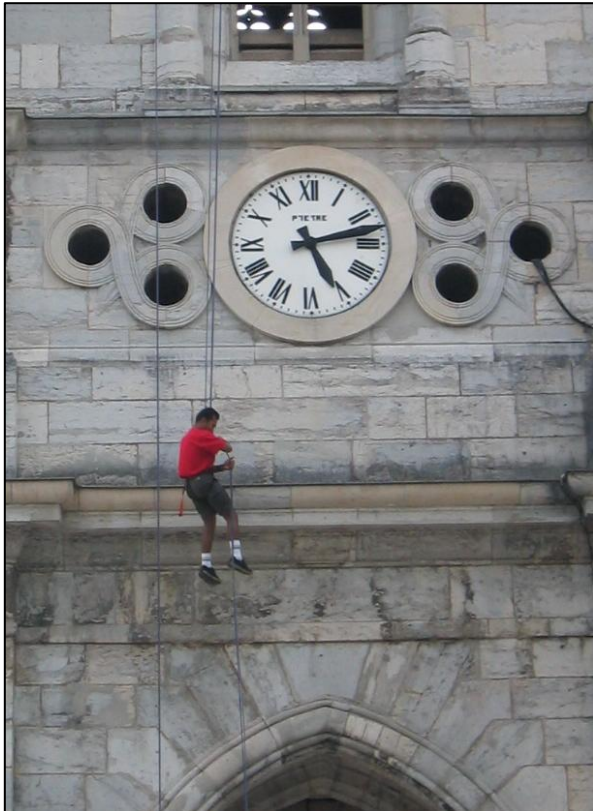
2003 : Prithivi