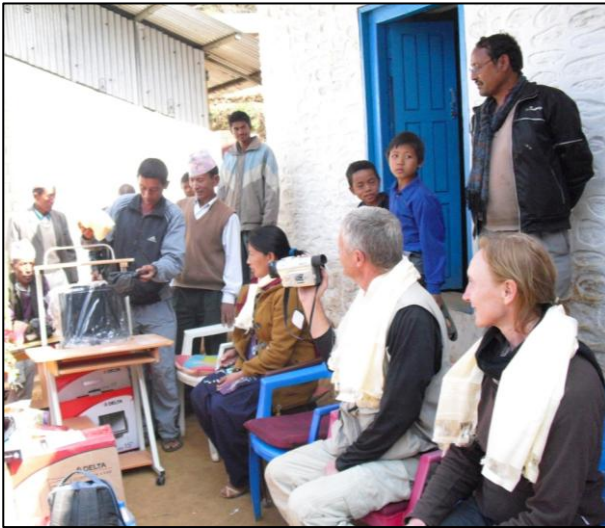
Achat de 5 ordinateurs et tables