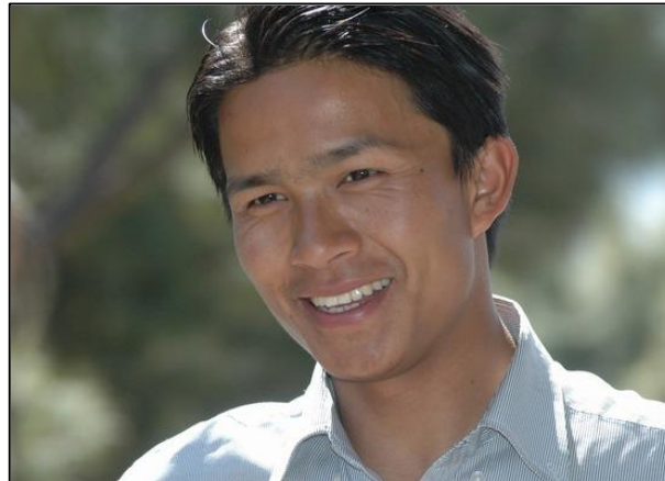
2007 : Dhana